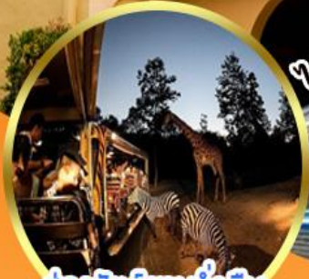
ล่องลัตุวยามค้ำคััน โนกัชาฟารัซัยใม่