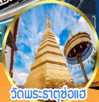
วัดพระธาตุดุช่อแอ